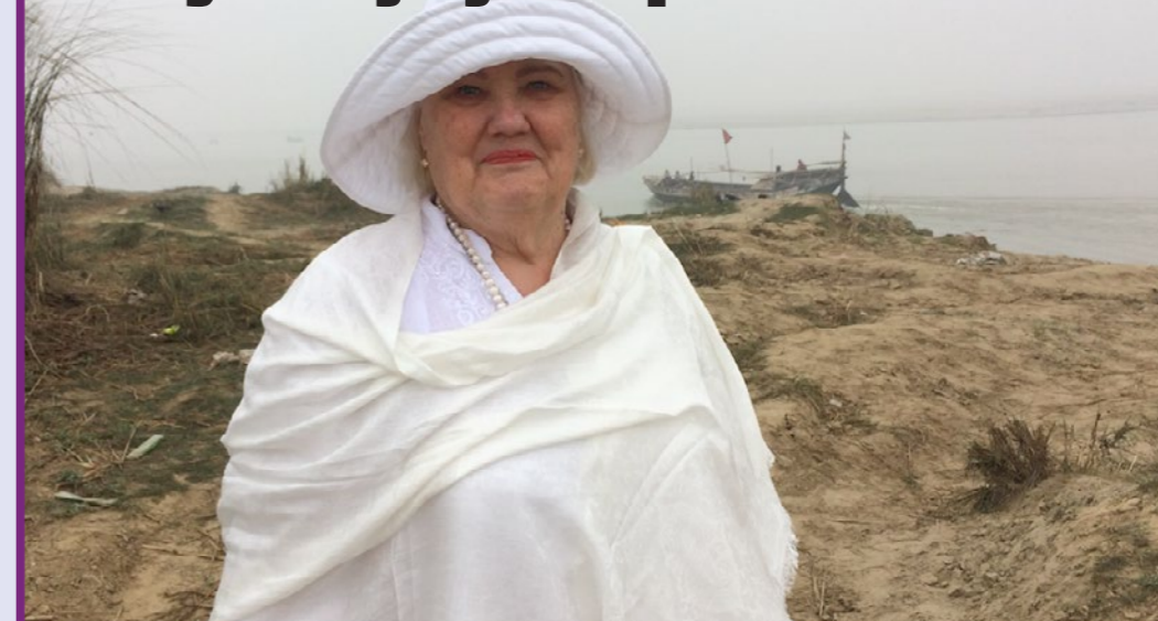
Lille Patnalla Kanges-joen rannalla Intiassa maailman suurinta valopylvästä rakentamassa v. 2016.