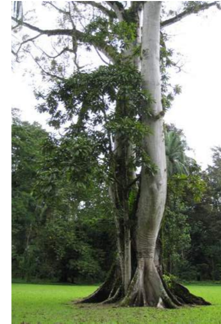
Ceiba – mayojen pyhä puu symboloi elämän kolmea tasoa näkyvässä maailmassa

Curandero(a)/Kunanael' mayalääkäri tai parantaja – tavallisesti curandero hoitaa hyvin monenlaisia vaivoja vähän kuin yleislääkäri. Osa curanderoista voi kuitenkin olla erikoistuneita tiettyihin vaivoihin kuten palovammojen tai haavojen ja tapaturmien parantamiseen ”puhaltamalla”. Osa curanderoista on erikois-