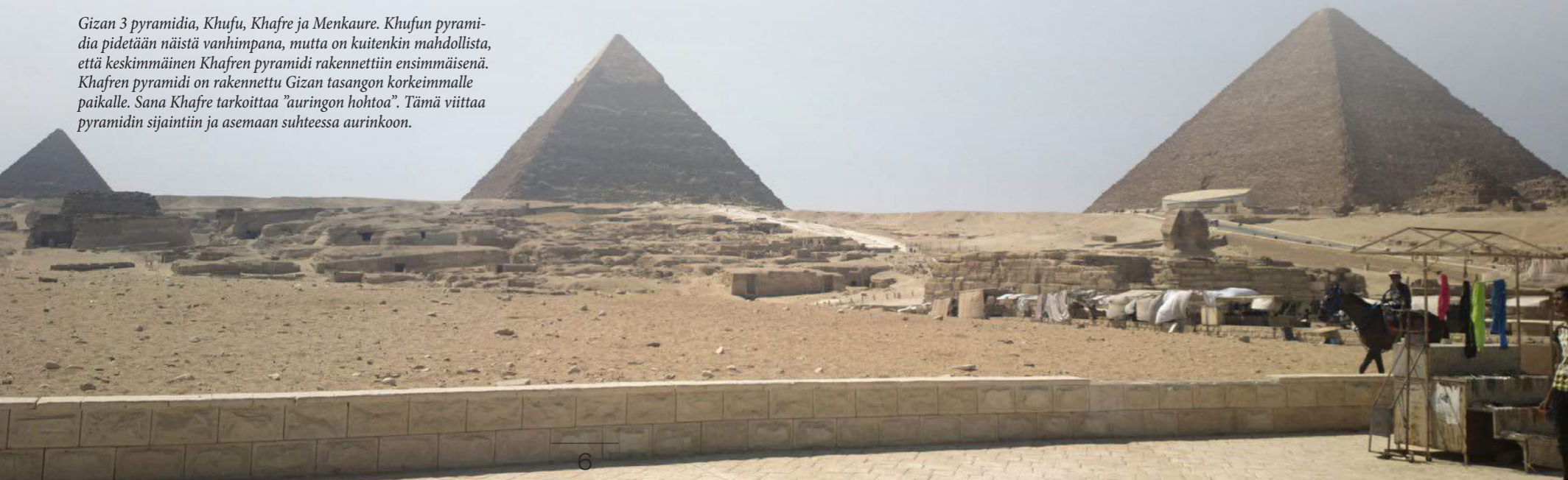
Gizan 3 pyramidia, Khufu, Khafre ja Menkaure. Khufun pyramidia pidetään näistä vanhimpana, mutta on kuitenkin mahdollista, että keskimäinen Khafren pyramidi rakennettiin ensimmäisenä. Khafren pyramidi on rakennettu Gizan tasangon korkeimmalle paikalle. Sana Khafre tarkoittaa "aurinkon hohtoa". Tämä viittaa pyramidin sijaintiin ja asemaan suhteessa aurinkoon.

Vastanotot Tku-Hki Tuula Huhtala 041 707 1920 tarottuula.wordpress.com