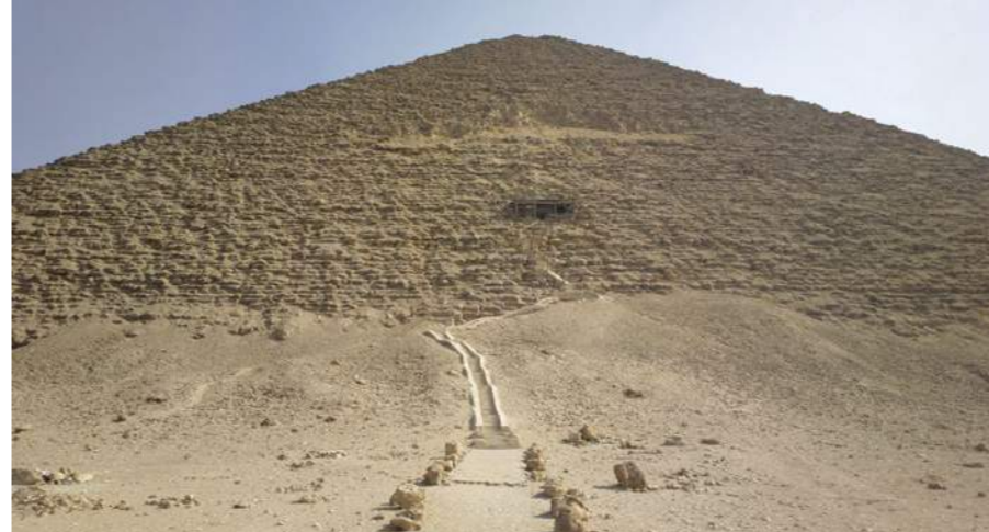
Punainen pyramidi on Egyptin kolmanneksi suurin pyramidi. Sen on ilmeisesti rakennuttanut faarao Sneferu, Khufun isä. Sneferun sanotaan rakennuttaneen 3 valtavaa pyramidia. Syytä tähän on vaikea selittää, jos pyramidien pääasiallinen tarkoitus on ollut hautaaminen.

Venäläinen tutkijaryhmä selvitti vuonna 2018, että suuri pyramidi keskittää sisälleen ja pyramidin alle sähkömagneettista säteilyä, radioaaltoja. Asia liittyy