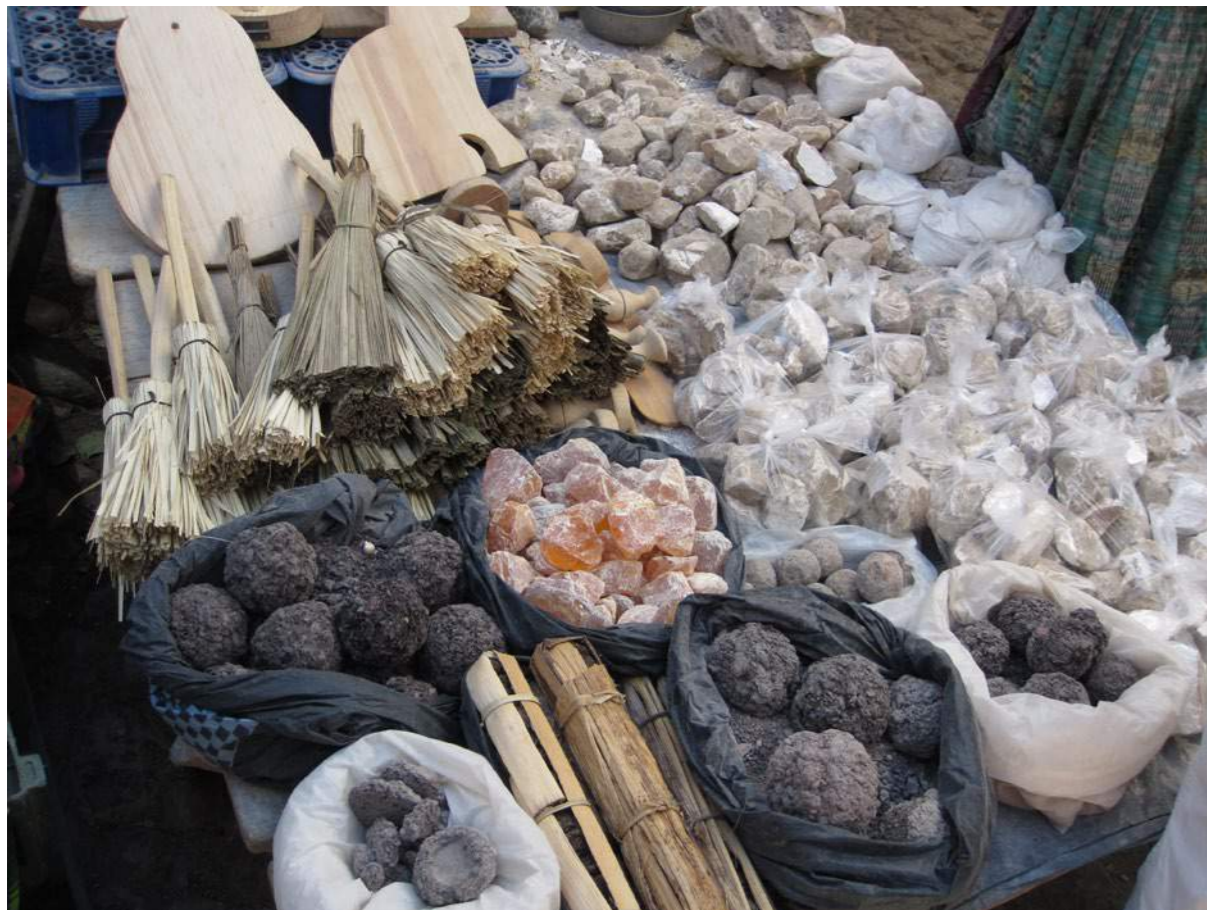
Seremoniavälineitä – hajupihkaa ym.

Mayalääketiede on kaksiosainen artikkeli, jonka toisessa osassa tarkastellaan mayojojen kasvilääkintää sekä mayojojen käsitystä psyykkisistä ongelmista ja henkisestä paranemisesta.